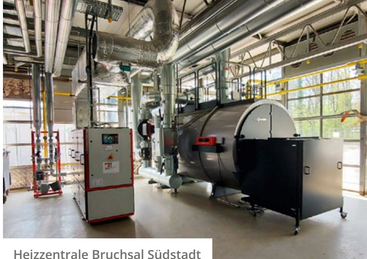
Heizzentrale Bruchsal Südstadt